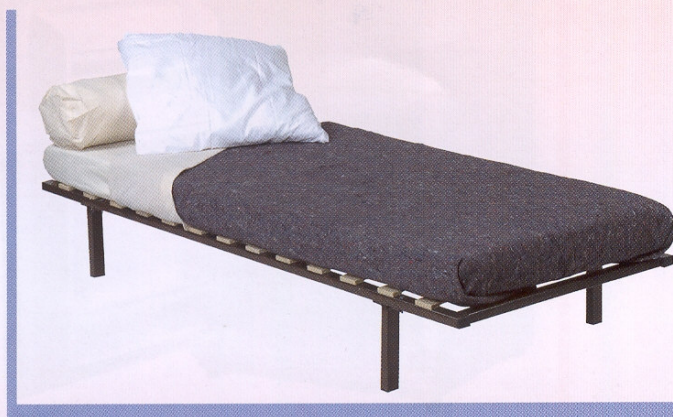
523.N et ACCESSOIRES