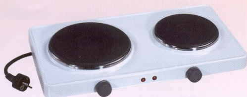
RÉCHAUD ÉLECTRIQUE RE1