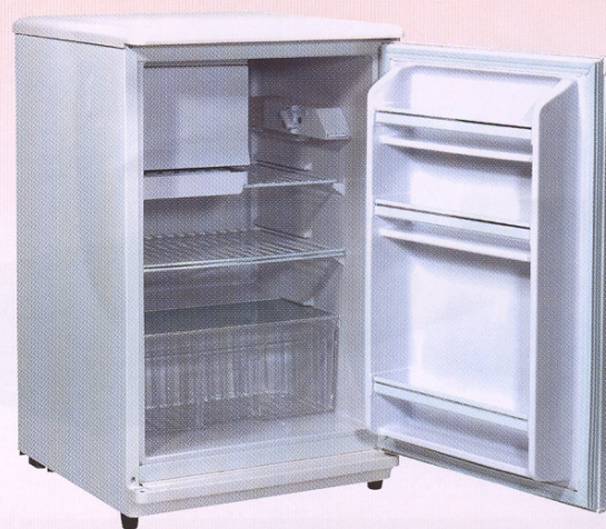
RÉFRIGÉRATEUR 140 L