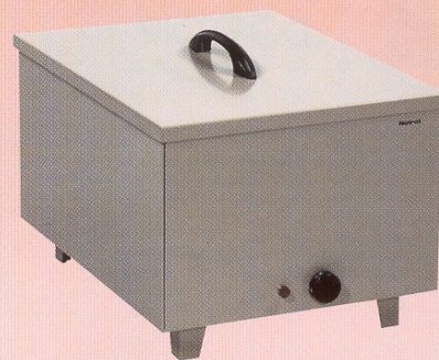
CHAUFFE GAMELLES 753